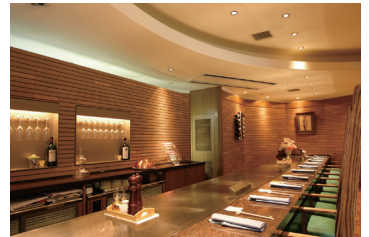
六角堂せせらぎ通り店

※2)：『BtoBプラットフォーム 受発注』は、株式会社インフォーマートのシステムです。