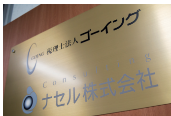
オフィスプレート